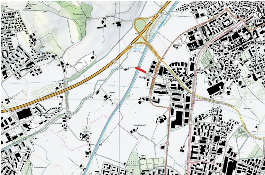
Der rot gekennzeichnete Teil der Schochenmühlestrasse in Baar wird im Abschnitt Altgasshof–Lorze umfassend saniert.

Charly Keiser, Kommunikationsbeauftragter Tel. +41 41 728 53 07, charly.keiser@zg.ch