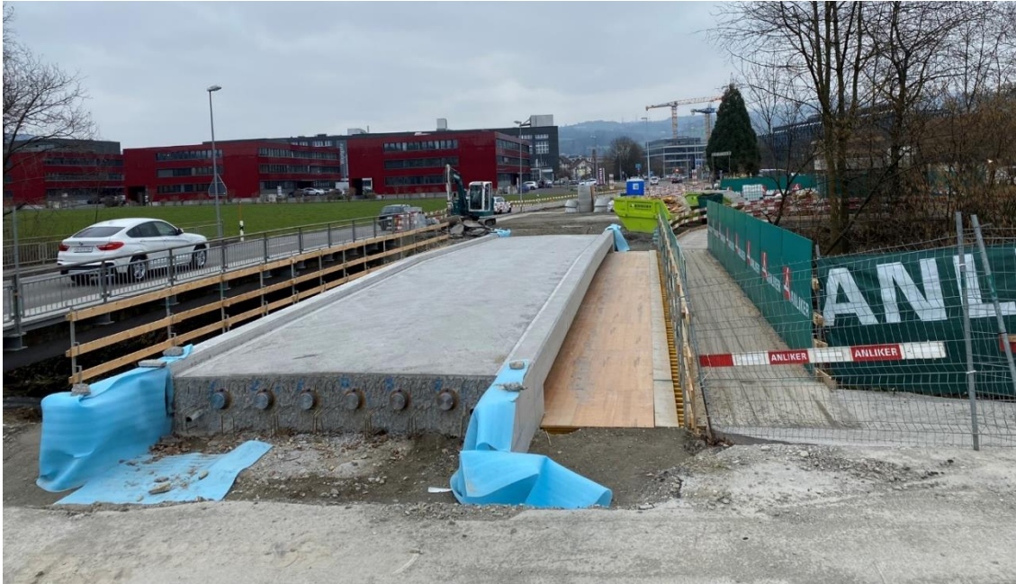
Die Arbeiten für den neuen Rad-/Gehweg auf der Schochenmühlestrasse in Baar schreiten zügig voran.