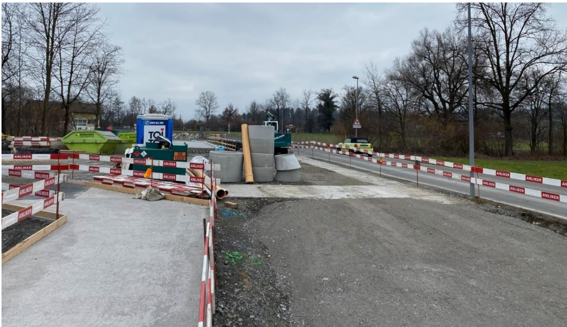
Die Schochenmühlestrasse erhält im Abschnitt Altgasshof–Lorze in Baar einen Geh- und Radweg.