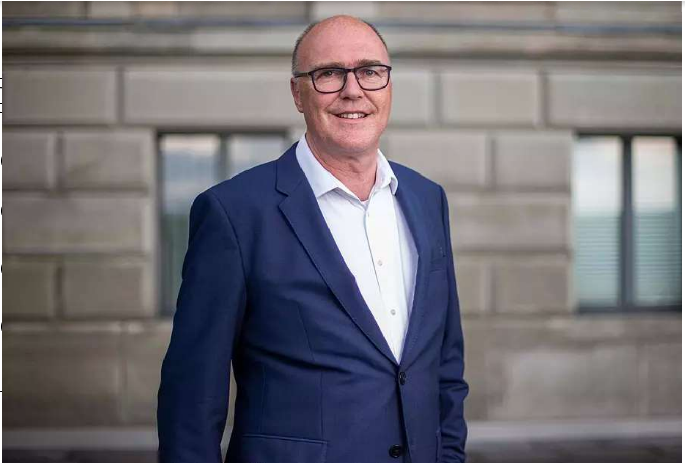
Zuger Gesundheitsdirektor Martin Pfister