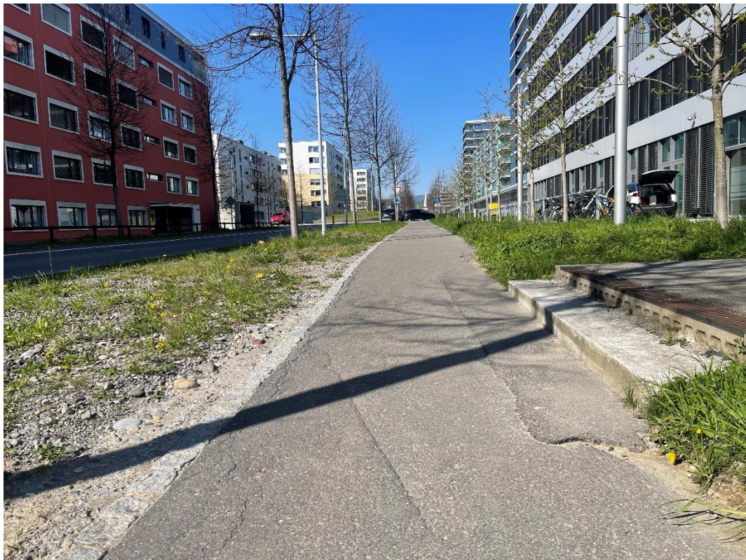
Das Trottoir der Nordstrasse in Zug muss auf dem Abschnitt Theilerstrasse bis Feldstrasse saniert werden.