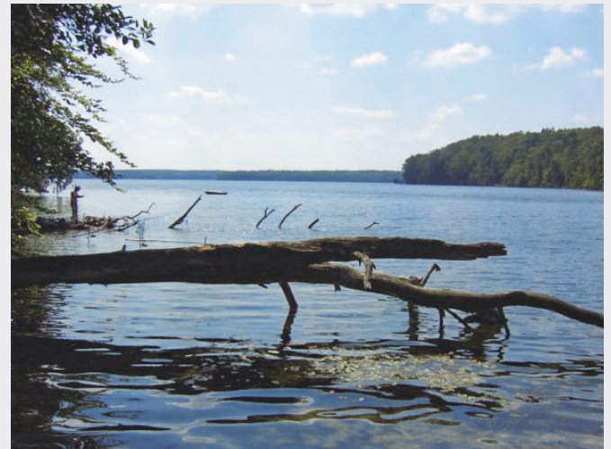
Der am besten untersuchte See bezüglich thermischer Verunreinigung: Stechlinsee in Norddeutschland

Der Stechlinsee in Deutschland (Oberfläche: 4,25 km 2 , maximale Tiefe: 68 m, Volumen: 0,1 km 3 ) ist ein See, der von 1966 bis 1989 für die Kühlung eines Kernkraftwerks genutzt wurde. Aus dem benachbarten Nehmitzsee wurden rund 300 000 m 3 /Tag Kühlwasser entnommen und um ~10 °C erwärmt in den Stechlinsee oberflächlich eingeleitet [34]. Dank zahlreicher Studien über die Auswirkungen dieser Nutzung ist der Stechlinsee der am besten untersuchte Fall einer thermischen Verunreinigung eines Sees.